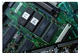
半導体・エレクトロニクス